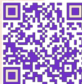
immagine in copertina:

Ricevi gli aggiornamenti sul canale WhatsApp dell'Associazione “Nuovo Accordo” →